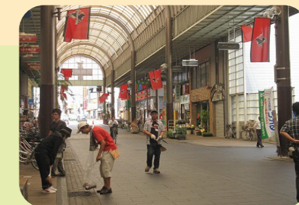
健軍商店街清掃ボランティア

月2回健軍商店街アーケードの清掃を行なっています。また、不定期にバルーンボランティアや地域で開催されるイベントのお手伝い等を共に活動して頂けるボランティアを募集しています。興味のある方は、お気軽にお問い合わせください。