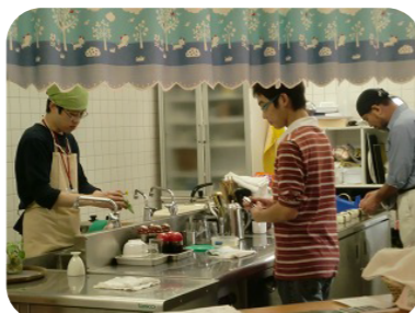
喫茶店の調理の職場体験にチャレンジ中！