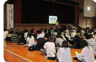
5月22日湧心館高等学校通信制の生徒へ事業説明