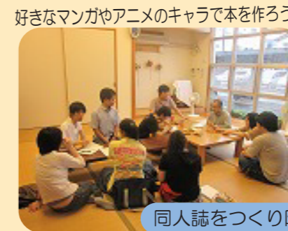
同人誌をつくり隊