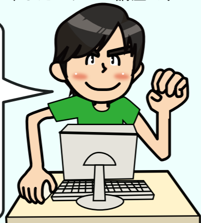
第1期修了生 (0さん、20代)

若者UPプロジェクトの講座が始まるのを知る少し前に、就活する場合、資格等を取得出来たらいいなと思っていました。説明会に参加し、使ったことなかったWindows 7やMicrosoft Office 2010に触れるということでも更に受講してみたいと思うようになりました。今回の若者UPプロジェクトを受講して苦手だったWordとPowerPointや、触れた事の無かったAccessを勉強できた事で、また少し自信が持てるようになって、次のステップに進みやすくなりました。今後はMOS等の資格取得に向けて勉強していこうと思います。