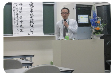
5月11日 文徳高校で先生方へ事業説明