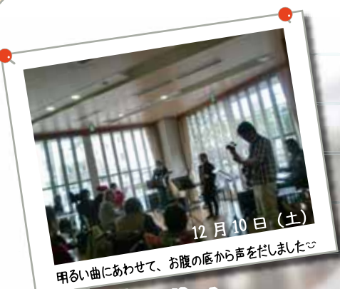
12月10日(土) クリスマスコンサート 明るい曲にあわせて、お腹の底から声をだしました。ゲストにニブリーズさんをお呼びして、みんなで曲に合わせて手拍子をとりながら熱唱しました。

若者同士が語り、地域の方々と交流する場面を様々な行事に合わせて開催しています。なかには、若者が発起人となったイベントも！目標をともに仲間同士お互いを高めあっています。