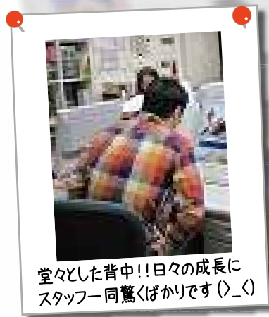
日々成長にスタッフ一同驚きばかりです (>_<)

当法人で12月から開始した事務活動ボランティア体験です！職場体験の一步前に親しみのあるサポステで、お仕事を体験します