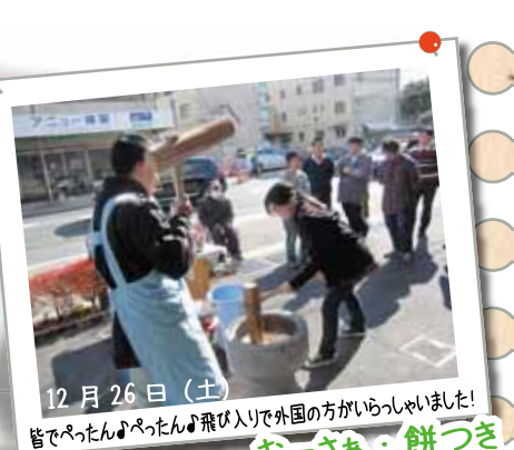
12月26日(土) おーさあ・餅つき @ 毎年恒例の餅つき！地域の餅つき名人に教えて頂きながら若者の「カ」でしっかり、もちをつきあげました！！