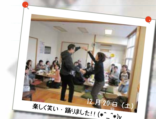
12月20日(土) サポステ・クリスマス会 @ サポステの若者から企画・立案されケーキ作りや飾り付け、プレゼント交換など、手作りのイベントを楽しみました！