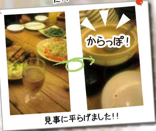
からっぽ！ 見事に平らげました！！ サポステ・忘年会、新年会 @ サポステの若者から発案の飲み会です！40名近い若者が集まり、「友達が増えた」、「楽しかった！」など、若者の笑顔がはじけたイベントでした。